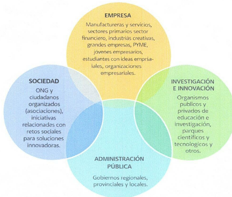
Imagen 01. Interacción de del Ecosistema Regional de Fomento del Emprendimiento y la Innovación bajo el modelo de cuádruple hélice.