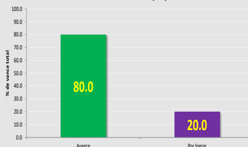
AVANCE GENERAL AL 30/10/16

Fuente: Base de datos DGGCEAU (2016). Al mes de Octubre, la UNJ tiene un avance general de 80%.